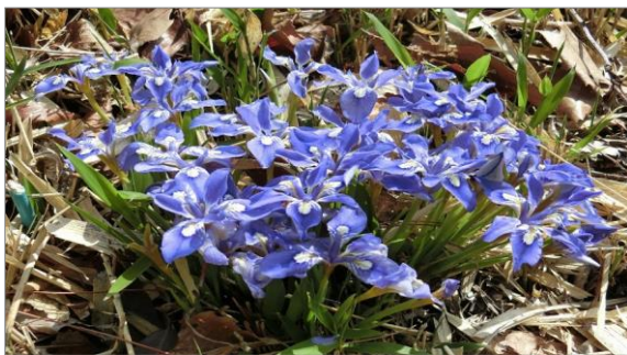
北条の宝 エヒメアヤメ

今後も風早の地の宝として、北条地区の歴史・文化・自然を大事にしていきたいと思えます。