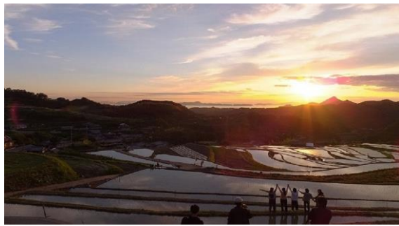
北条の宝 棚田からの夕日