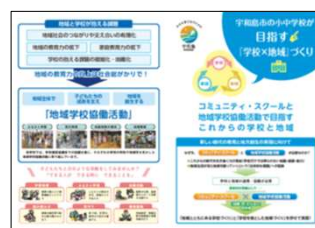
リーフレットの作成